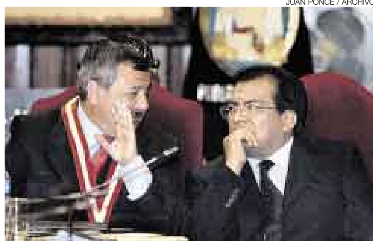
DIÁLOGO. La Sala Plena de la Suprema se reunió con los legisladores.

cambios constitucionales se realizaría en el transcurso de la segunda legislatura, que abarca el período marzo-junio.