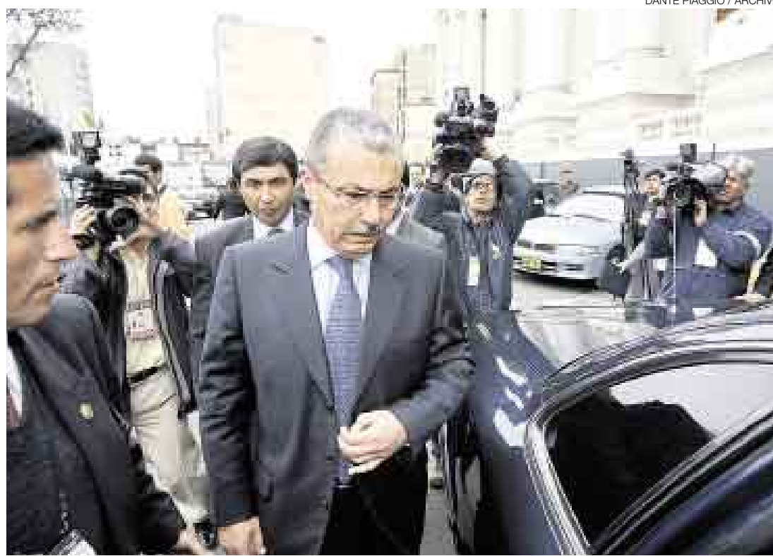
A CORTAR DE RAÍZ. El ministro Vallejos despidió a los trabajadores del SIS que fueron encontrados cometiendo irregularidades, algo que deberá detallar a la fiscalía para que proceda a la denuncia correspondiente.

Respecto de si el ministro Vallejos debía ser denunciado por