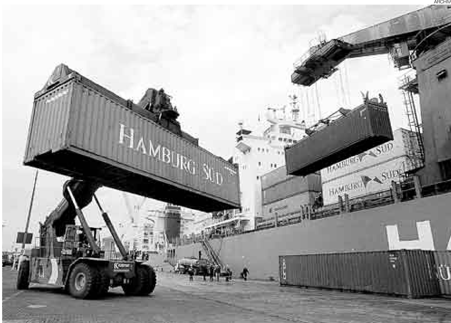
DISCREPAN. Mientras los exportadores observan con preocupación la reducción de aranceles, otros sectores, como Cómex Perú, opinan a favor de la medida.

"Muchas de las partidas y subpartidas que han sido afecta-