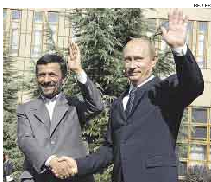
ALIANZA. Vladimir Putin defendió la política nuclear de Irán y advirtió a Washington sobre cualquier intento de ataque al país persa.

En la declaración final de la cumbre, las naciones del Mar Caspio apoyaron el llamado de