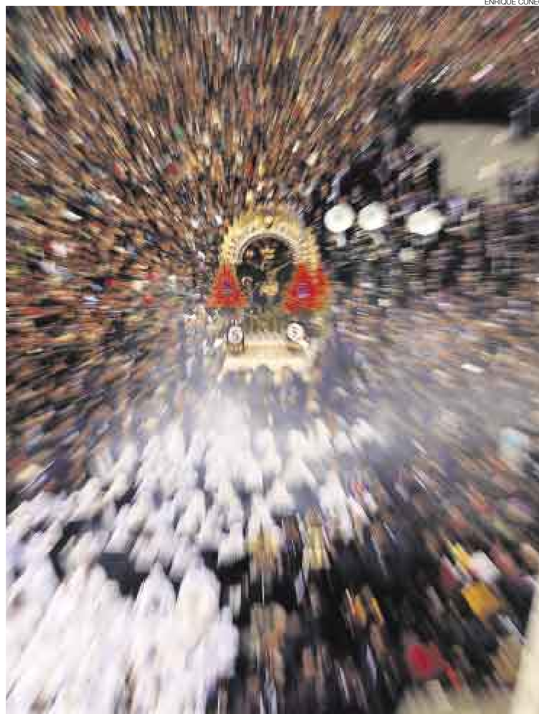
DEVOCIÓN QUE NO MUERE. Más de tres siglos y medio no han sido suficientes entre los devotos peruanos que, venidos de todos los rincones del país, acompañaron al Cristo Moreno para expresar su devoción y agradecimiento por el milagro cumplido. La imagen retornará hoy al templo de Las Nazarenas.