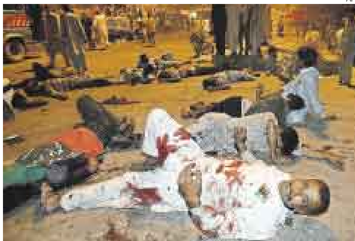
TRAGEDIA. Las imágenes de sangre y dolor inundaron Karachi, luego del terrible atentado.

daño. La policía y funcionarios de su partido dijeron que fue llevada de inmediato a su casa. Bhutto salió ilesa de una de las explosiones más letales en la historia de Pakistán, luego de que bajara del camión que la transportaba por las calles de la ciudad que estaban llenas de cientos de miles de sus seguidores. Retorno ensombrecido. [B12]