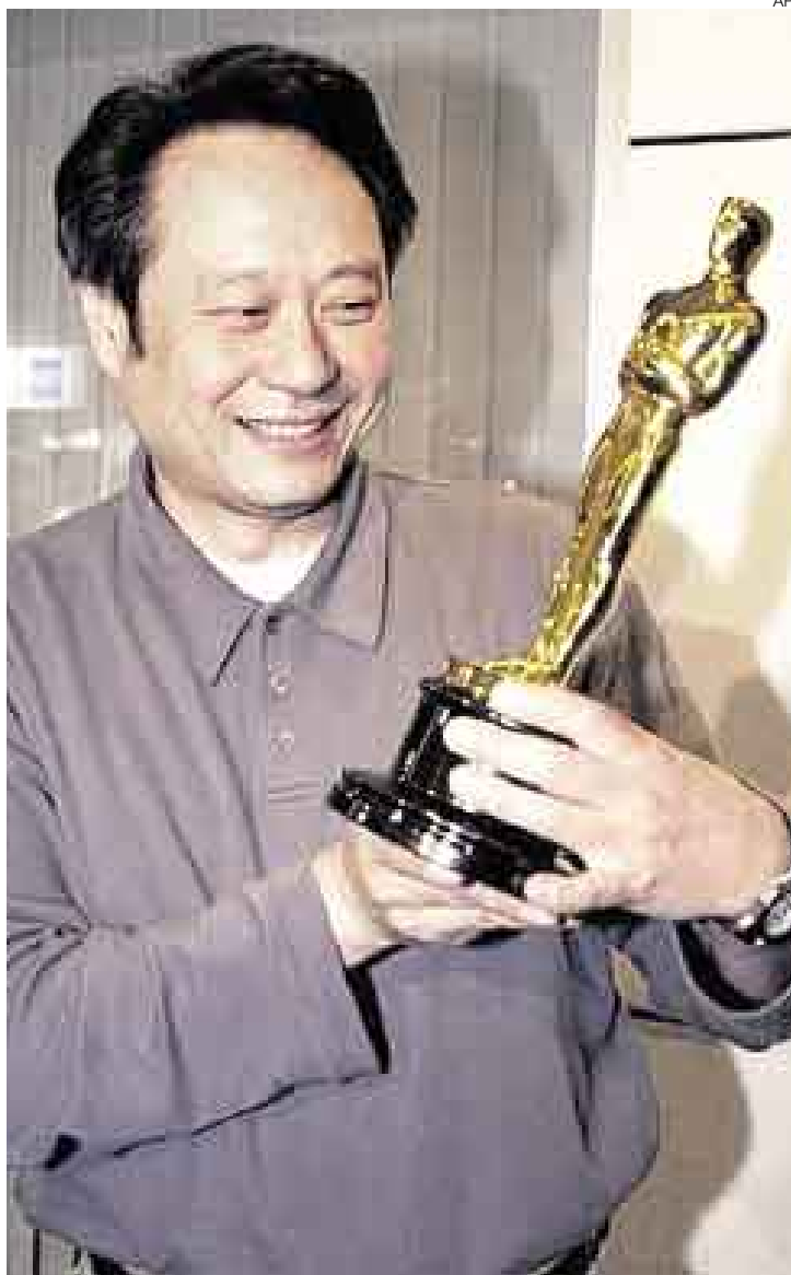
TAN LEJOS, TAN CERCA. La decisión de la Academia de Hollywood de vetar la participación de "Lust, Caution" desata suspicacias.

"El filme habla de lo absurdo que es que dos países vecinos,