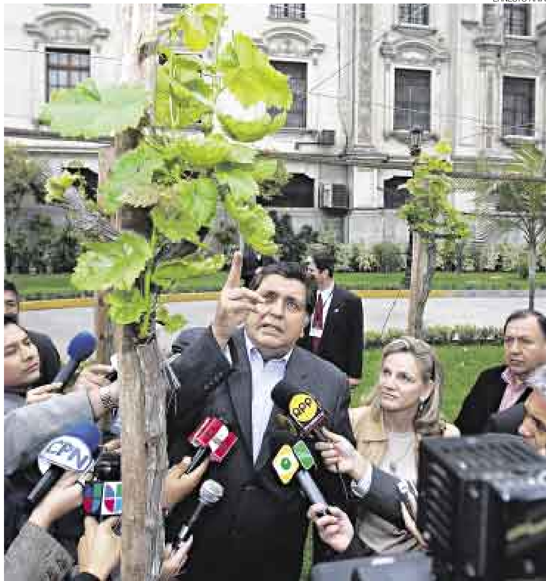
HOJAS DE PARRA. El presidente García espera la propuesta de Del Castillo sobre el cambio de ministros.

“¡Ah, ¿estamos con los números también?! Eso lo dirá el primer ministro. Todavía no ha hecho la propuesta que tiene que hacer. Será en el momento políticamente más oportuno”.