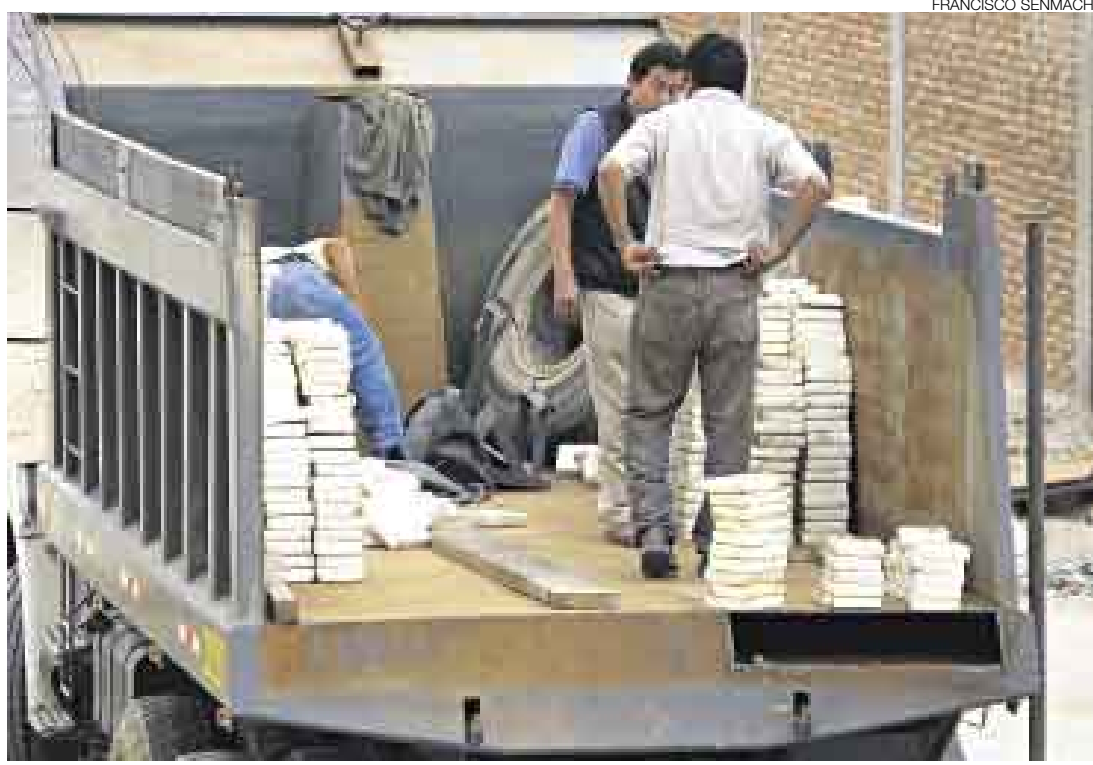
CARGA PESADA. Miembros de la Divandro de Piura inspeccionan la droga hallada en este camión.

Sin embargo, la operación del camión Volvo se frustró, pues personal especializado de la División Antidrogas (Divandro) de Lima y Piura intervino el vehículo sospechoso cuando se es-