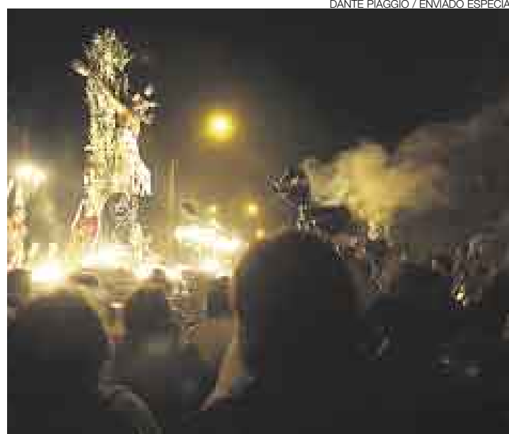
LA FE MÁS FUERTE QUE NUNCA. En horas de la noche, los feligreses acompañaron devotos al santo patrón de la castigada ciudad de Ica.

A este grueso contingente militar y policial se sumarán brigadas de salud y Essalud, socorristas del Cuerpo de Bomberos y de la Cruz Roja que estarán atentos ante cualquier eventualidad que se presente en esta procesión, declarada por Defensa Civil como de alto riesgo.