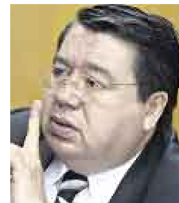
MATUTE. En defensa de su familia.

Comisión legislativa pide informe sobre uso que habría dado esposa del contralor a vehículo