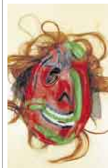
PELIGRO. La máscara no tiene un diseño seguro para respirar y ver.

Tenga cuidado con el diseño y material de los disfraces