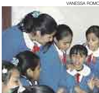
EN COMAS. Pequeños periodistas.

Todos los días después de clases, el salón de sexto grado del colegio San Eulogio de Comas se convierte en una sala de redacción. Los periodistas, once alumnos que tienen entre 10 y 11 años, ubican en sus carpetas los textos de "Expresémonos", la publicación que llevan siete meses elaborando para presentar al concurso Crea tu Propio Periódico Escolar de El Comercio. Para la mayoría de ellos, salir en busca de la noticia, tomar fotos y diseñar es algo nuevo, pero desde hace dos años las horas de clase de este colegio incluyen un espacio para aprender las labores de la prensa.