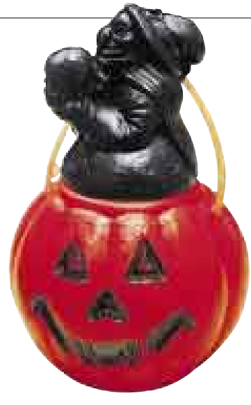
SE DESPRENDE. La pintura negra se sale al menor contacto.

■ El material de los disfraces debe ser resistente al fuego. Sus accesorios, como por ejemplo espadas, deben ser de materiales suaves y flexibles.