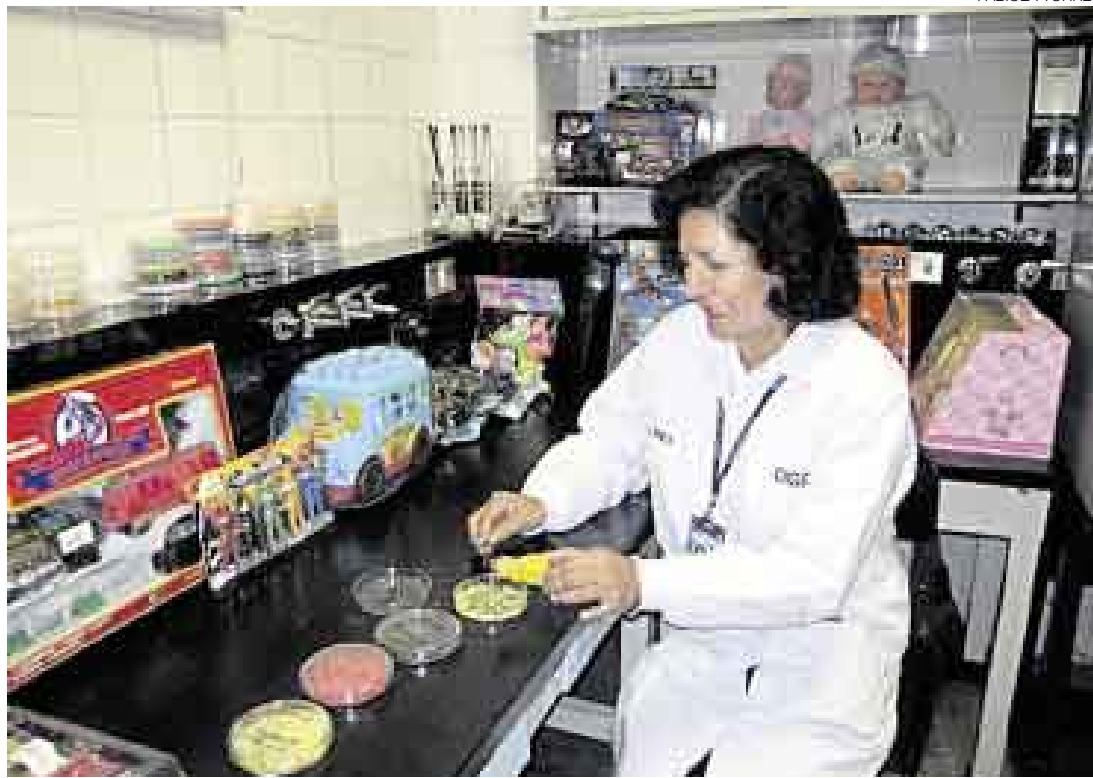
BAJO LA LUPA. Decenas de juguetes son analizados en el laboratorio de la Digesa como parte de la vigilancia sanitaria de oficio que realiza junto con la policía y la fiscalía.