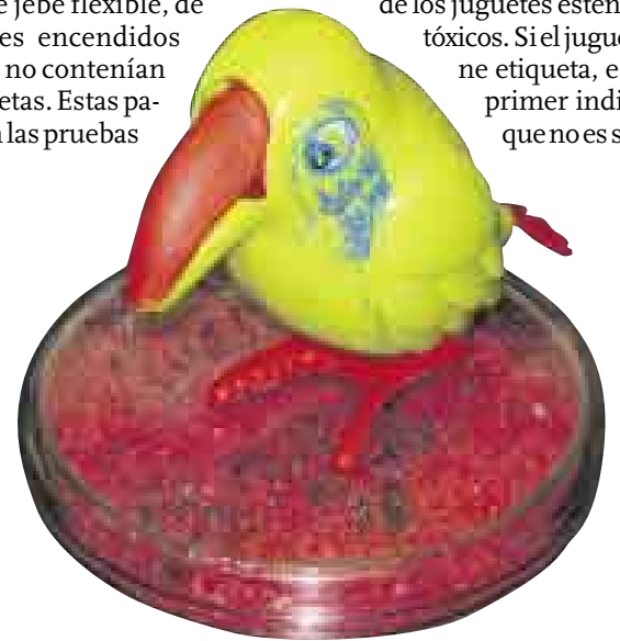
TÓXICO. Este lorito a cuerda puede engañar a muchos, pero fue elaborado con pinturas de elevada concentración de plomo.

La Asociación Peruana de Consumidores y Usuarios y la Comisión de Protección al Consumidor del Indecopi recomiendan al público comprar juguetes procedentes de industrias formales que puedan demostrar que cuentan con estándares de calidad garantizados. El mercado informal no garantiza que los pigmentos, solventes y materiales en general de los juguetes estén libres de tóxicos. Si el juguete no tiene etiqueta, este es un primer indicador de que no es seguro. ■