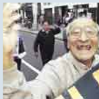
QUE NO SEA TARDE. QUIEREN COBRAR DEVENGADOS MÁS RÁPIDO.

es una subsidiaria de la sudafricana SAB Miller). Esta apreciación indigna a los seis mil trabajadores peruanos que laboramos en Backus. El hecho de que los accionistas no sean peruanos o no estén domiciliados en el país, no justifica una apreciación como la enunciada. Cristal es la cerveza líder del mercado y es peruana desde 1921, oportunidad en que tampoco era de accionistas locales. Sin embargo, su entroncamiento con el Perú en todas sus manifestaciones populares, su elaboración, embotellamiento, traslado y comercialización por miles de peruanos pone fuera de duda su peruanidad.