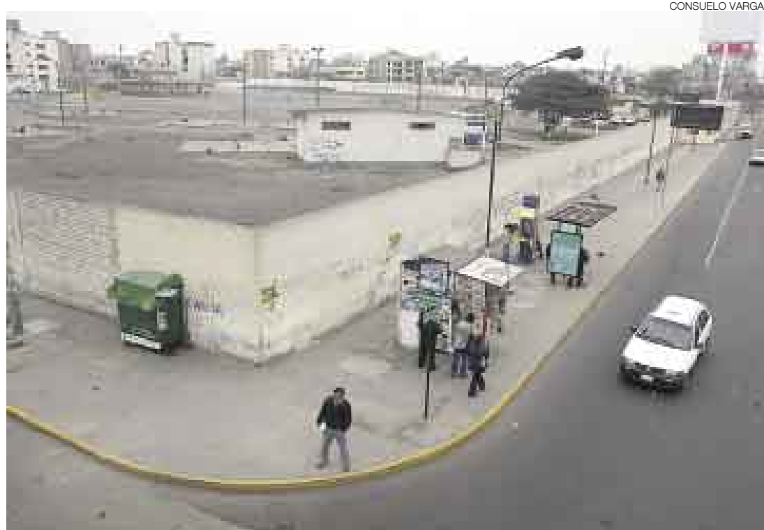
EN SAN BORJA. La nueva sede del Instituto de Salud del Niño solo atenderá los casos de mayor complejidad.

La nueva sede tendrá un edificio de ocho pisos con capacidad para 250 camas de hospitalización, helipuerto, equipos y servicios de atención especializada y de alta complejidad integrados a un sistema de información