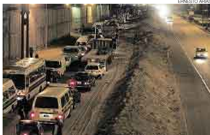
SOBRE LA HORA. El mal hábito de esperar el último momento para cumplir las revisiones técnicas se observó ayer en la planta de Villa El Salvador.