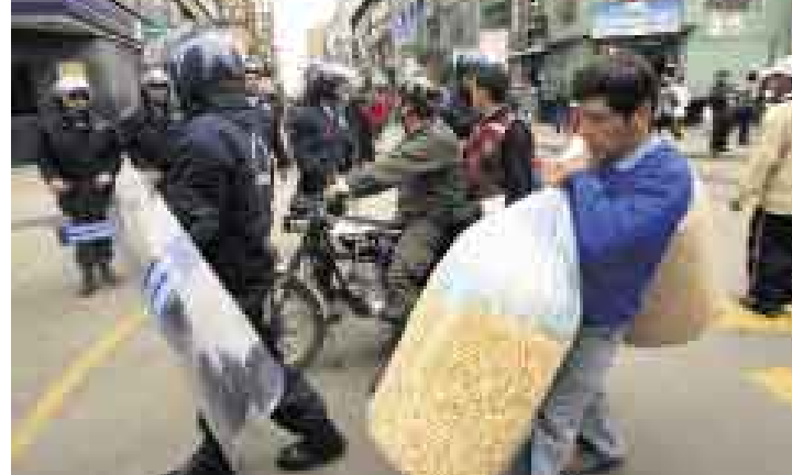
VIGILANCIA. Policías y serenos evitaron el ingreso de los ambulantes.