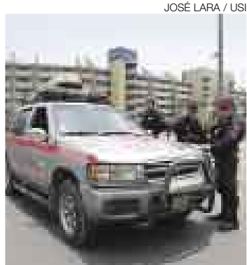
INSEGURO. El Monumental fue escenario de un verdadero caos.

El escenario elegido para el 7 de noviembre fue el nuevo estadio Centenario Manuel Rivera Sánchez, inaugurado en junio de este año y cuya capacidad alcanza los 25 mil espectadores. pese a que la dirigencia crema quedó desilusionada por la negativa a jugar en casa, tuvo que aceptarlo al ver las condiciones