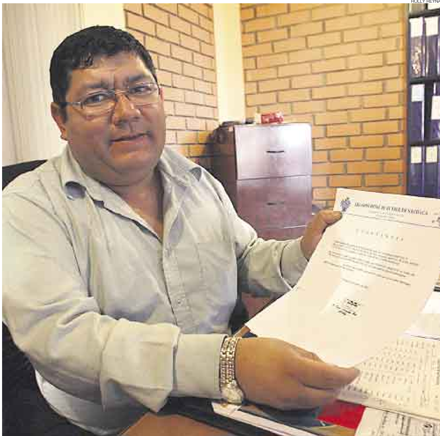
ACÁ ESTÁ. Enciso muestra la constancia de la Liga de Sachaca, la cual confirma que fue tesorero del Sport Villa de ese distrito, club por el que no veló.

El presidente del Total Clean nos enseñó una comunicación oficial del CSVA dirigida a la Liga Distrital de Fútbol de Sachaca, del 20 de setiembre del 2001, en la que el club pedía permiso para jugar en