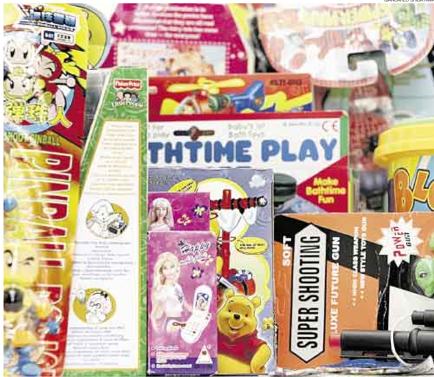
VISTOSAS, PERO INCOMPLETAS. Más allá de los atractivos diseños y envases, la etiqueta de un juguete debe ser comprensible y útil para el consumidor.

Aunque la campaña navideña no es la mejor coyuntura, la Dirección General de Salud Ambiental (Digesa) otorgó un período de adecuación a la ley para los fabricantes e importadores de juguetes y útiles de escritorio, quienes por seis meses (contados desde el 16 de setiem-