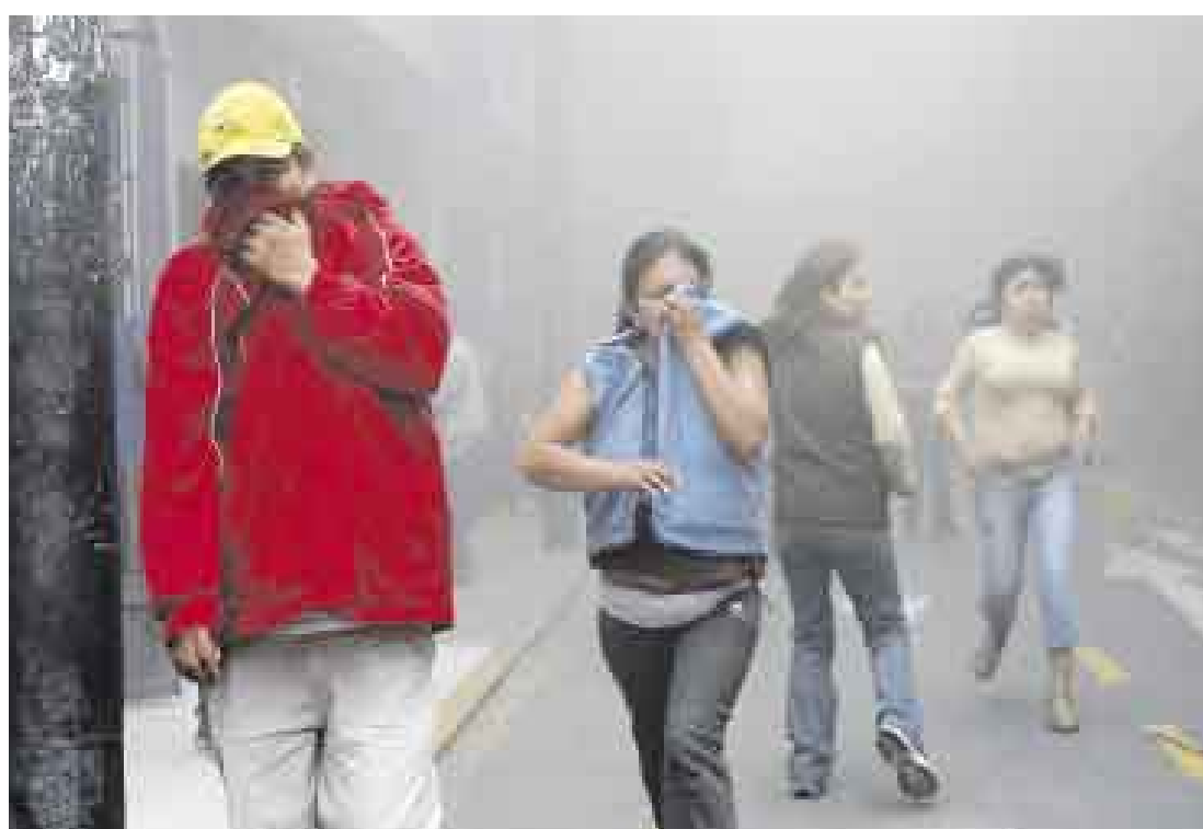
IRRESPIRABLE. Mesa Redonda es una bomba de tiempo. Comerciantes y transeúntes huyen del lugar invadido por el humo, aunque muchos vendedores se resistieron a salir e intentaron recuperar sus mercancías.