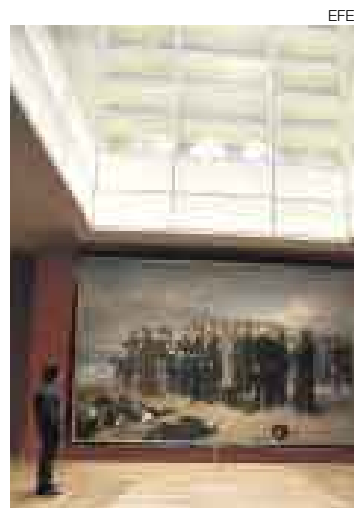
A LO GRANDE. El museo cuenta ahora con 22 mil metros cuadrados.

MADRID [EFE]. El Museo del Prado de Madrid inauguró el martes oficialmente la mayor ampliación en los casi 200 años de historia de la pinacoteca española, lo que la convierte en una de las más modernas y emblemáticas del mundo.