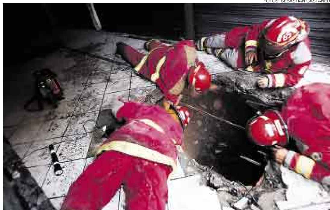
FATIGA. Los bomberos abrieron un forado en el primer piso para examinar desde allí la situación del sótano.

El sótano era motivo de especial preocupación. Se presumía que to-