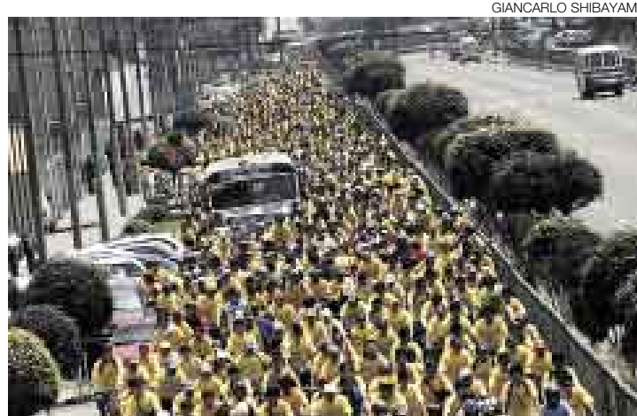
A TODO PEDAL. Miles de ciclistas tiñeron de amarillo las pistas de Lima.

Las pistas de Lima se llenaron ayer de bicicletas. Unos 10.000 ciclistas participaron ayer en la Tercera Gran Bicicleteada organizada por la Municipalidad de Lima. A puro pedal, los participantes se desplazaron por las principales calles del Cercado, Breña, Pueblo Libre, San Miguel, Magdalena, Lince, San Isidro y Miraflores. Quienes no disfrutaron mucho fueron los automovilistas.