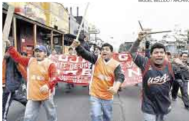
A LAS CALLES. De nuevo la CGTP saldrá a protestar contra el Gobierno.

En víspera de la movilización que los agremiados de la Confederación General de Trabajadores del Perú (CGTP) realizarán para protestar contra el supuesto incumplimiento del Gobierno de sus compromisos con los trabajadores mineros y los docentes universitarios, el presidente del Congreso, Luis Gonzales Posada, se reunió ayer, en la sede del