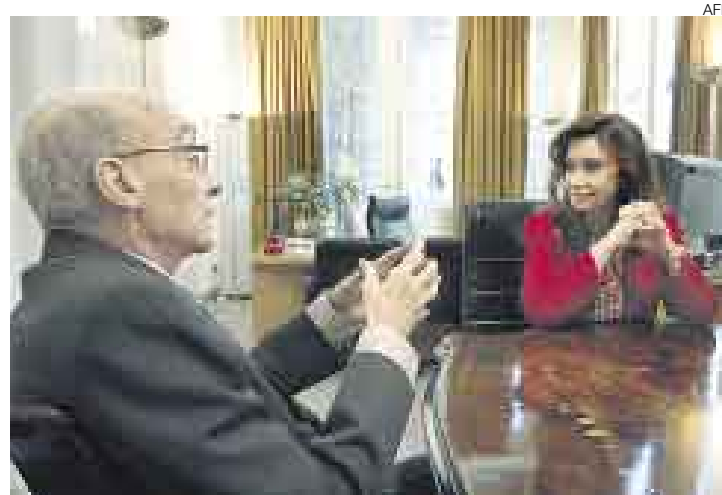
ENCUENTRO. Saramago y Fernández conversaron un largo rato.