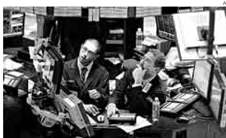
PREOCUPACIÓN. El problema de los créditos en EE.UU. aún no termina. A los malos resultados de los bancos, siguieron los de algunas industrias.

■ Volatilidad continuará hasta que se conozca la extensión del problema crediticio en EE.UU.