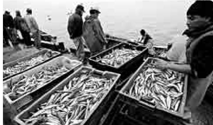
ATRASO. El fenómeno de La Niña retrasó el desove de anchoveta, aunque se estima que su efecto será positivo en las costas peruanas.