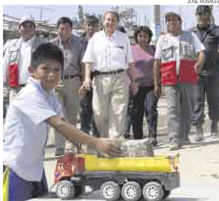
EMPOLVADO. El ministro de Vivienda Hernán Garrido Lecca asegura que por ahora prefiere ensuciarse los zapatos en Pisco.

Según dijo, la Ley Marco de la Promoción de la Inversión Descentralizada establece un plazo de 30 días, por lo que él propuso ampliarlo a 60 días, “mientras que la ministra de Transportes, Verónica Zavala, planteó 90 días. Frente a estas dos alternativas el Consejo de Ministros no llegó a ningún acuerdo y las cosas que-