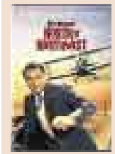
NORTH BY NORTHWEST