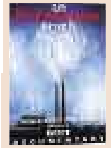
AN INCONVENIENT TRUTH

LOS EXTRAS: Avances, menú interactivo y poco más. El prodigioso filme compensa todo.