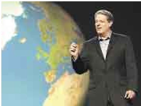
EL HOMBRE DEL CLIMA. Al Gore no expone algo que va a suceder, sino que está ocurriendo.

LA PELÍCULA: Se trata del documental más comentado de los últimos años, resultado del esfuerzo personal del ex vicepresidente Al Gore para alertar al mundo entero sobre el calentamiento global. Se trata de un fenómeno que está ocurriendo y que contribuye al desgaste de nuestras fuentes vitales. A tal punto que el mundo cambiará drásticamente en 40 años. El apoyo científico es amplio y variado, también el trabajo de campo, que incluye filmaciones alrededor del planeta, como el Perú (el deshielo de los Andes). En los últimos meses los enemigos políticos de Gore han tratado de restarle seriedad al filme señalando defectos e imprecisiones. Pueden tener razón, pero el mensaje de "La verdad incómoda" es uno y es válido. Y eso no lo pueden