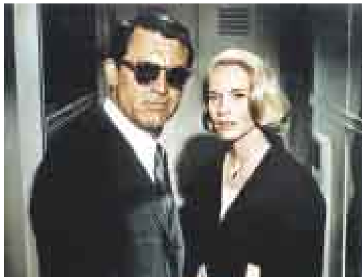
ESPIA INVOLUNTARIO. Cary Grant y Eva Marie Saint emprenden una fuga kafkiana.