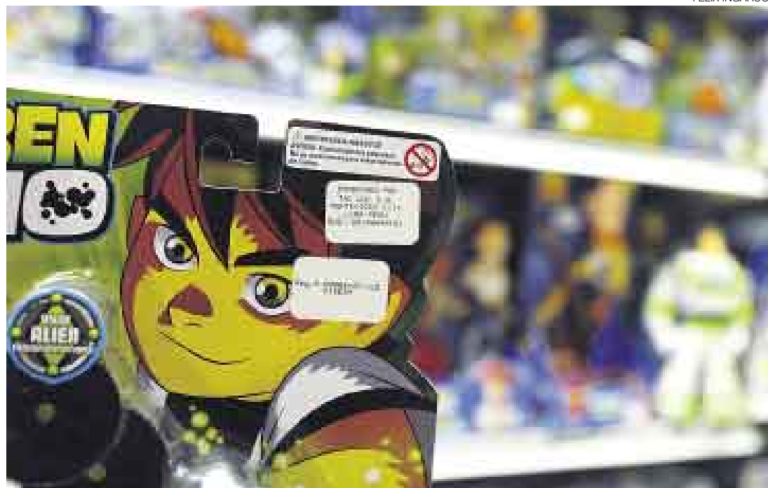
CORREGIDAS. En todas las tiendas de Tai Loy los juguetes que están a la venta han sido nuevamente etiquetados para incluir la información necesaria para el usuario de acuerdo a la normativa, la cual debe estar en castellano.

La Comisión de Protección al Consumidor del Instituto Nacional de Defensa de la Competencia y de la Protección de la Propiedad Intelectual (Indecopi) realizó hace unas semanas la primera fiscalización del etiquetado de juguetes que están a la venta en seis tiendas: los hipermercados Tottus y Metro S.A., Tai Loy, Ripley, Sociedad Happy Land Perú y Saga Falabella. En presencia de los representantes de las tiendas, los inspectores evaluaron los productos y llenaron un