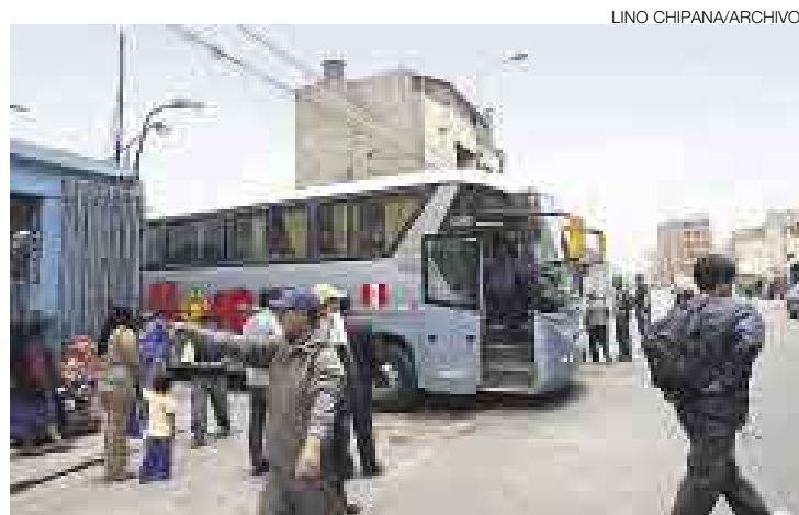
SERVICIO BAJO LA LUPA. La comuna limeña también emitirá normas sobre las condiciones para instalar terminales terrestres en Lima.

La promesa que en su momento hiciera Alberto Andrade Carmona y también el actual alcalde Luis Castañeda Lossio, de dotar a la capital de dos terrapuestos para el transporte interprovincial, seguirá siendo solo eso, una propuesta sin plazo. Y es así porque la comuna limeña carece de terrenos que le permitan reactivar el concurso internacional de proyectos integrales para otorgar