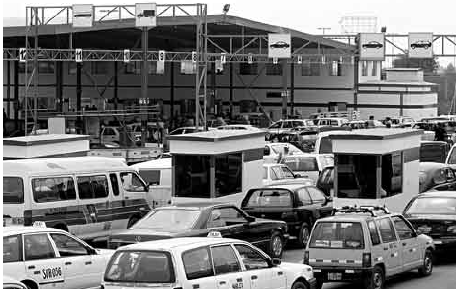
PÉRDIDA DE HORAS-HOMBRE. El Cidatt estima que unos dos mil vehículos fueron afectados por las largas colas en las plantas de revisiones técnicas.