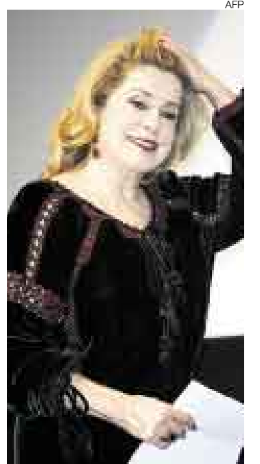
RECONOCIDA. Catherine Deneuve apoya el cine argentino.

El festival se extenderá hasta el 25 de noviembre. ●