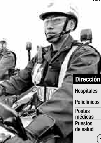
GERMÁN FALCÓN / ARCHIVO

Para atender tales demandas y otras se necesita, en concreto, recibir S/.396'598.969 adicionales. Como telón de fondo se alerta sobre el recrudecimiento del accionar narcoterrorista.