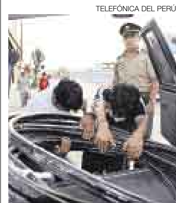
CABLES. De ellos sacan el cobre.

■ Entre enero y octubre del presente año se registraron 5.193 robos en todo el país