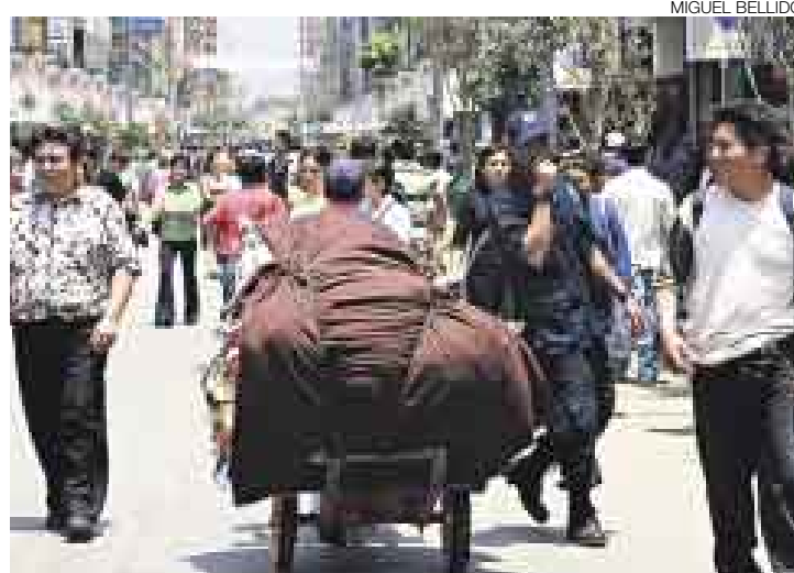
TRANSITABLE. La circulación por las calles de Gamarra ahora es más fluida, pero aún subsiste gran número de ‘jaladores’ y carretilleros.

■ También se vigila las galerías que han sido evaluadas por el Indeci con el objetivo de que subsanen las deficiencias y mejoren la seguridad.