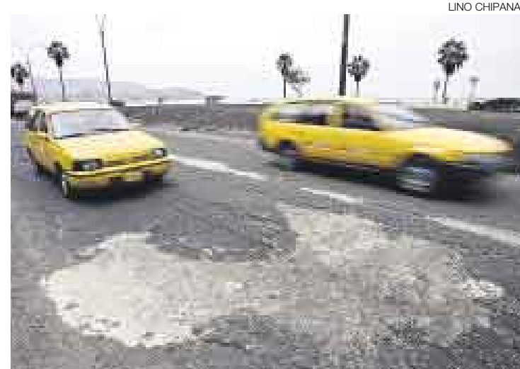
REHABILITACIÓN IMPOSTERGABLE. Este es uno de los baches que se ha formado en las pistas del circuito de playas de la Costa Verde.

El funcionario indicó que Barranco aguardaba que el Reglamento de la Costa Verde se apruebe para determinar qué proyectos se pueden presentar y trabajar en su jurisdicción.