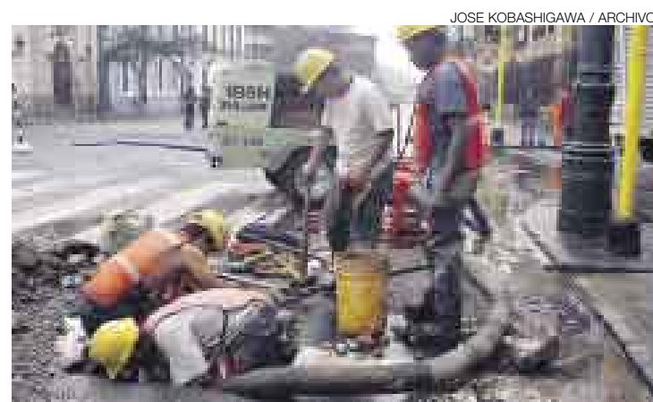
OBRAS. Un total de 21 trabajos de mantenimiento y reparación de tuberías obligará a Sedapal a cortar el agua en diversos distritos de la capital.

cuatro de la avenida Cristóbal de Peralta, en Surco, se realizará una evaluación por el interior de la tubería matriz en un tramo de un kilómetro. Mediante equipos