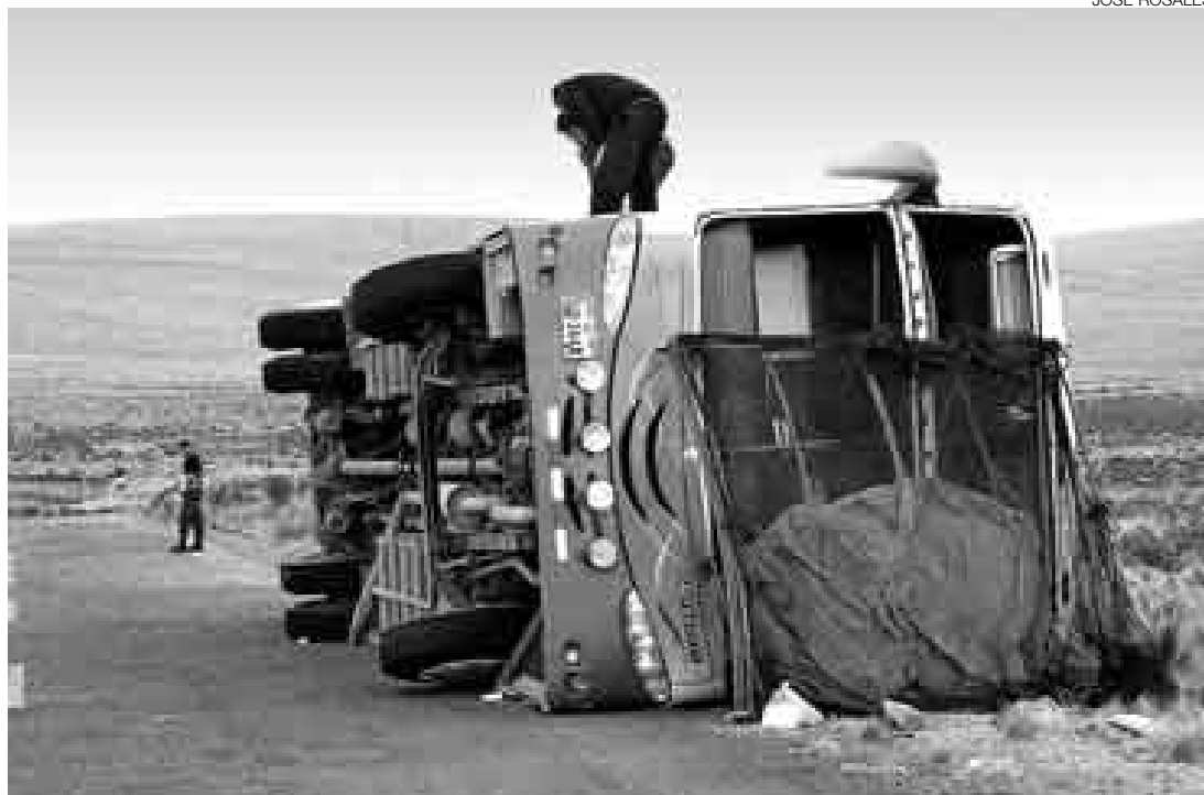
EXCESO DE VELOCIDAD. Según informó la policía, el vuelco del ómnibus en el que viajaban las alumnas del colegio Inmaculada Concepción de Talara se habría producido por el exceso de velocidad.

El segundo accidente ocurrido ayer en Ica fue un choque entre el camión de placa YI-4069—que remolcaba una cisterna vacía de propiedad de la empresa Lima Gas—y