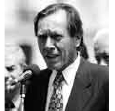
NECESARIA. Federico Salas señala que inversión es imprescindible.

El presidente regional Federico Salas Guevara Schultz solicitó al Estado que invierta en la zona nororiental de Huancavelica, donde están ubicados los distritos de Tintay Punco, Huachocolpa y Salcahuasi para contrarrestar al narcoterrorismo. "No solo se trata de reprimir, sino de invertir", anotó. Agregó que el gobierno regional presentó al Ejecutivo una propuesta técnica para la realización de diversas obras en esa zona con una inversión de 30 millones de soles.