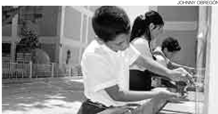
UNA DÉCADA. Según indicaron algunos directores de colegios, algunas deudas por servicio de agua tienen un atraso de hasta diez años.

Otros 50 mil escolares corren el riesgo de quedar en la misma situación en los próximos cinco días.