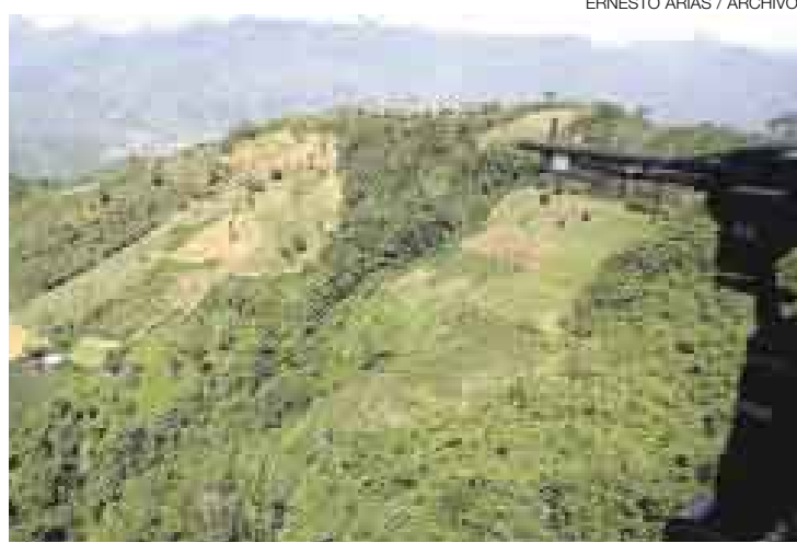
PEDIDO. Defensa e Interior requieren una ampliación presupuestal para erradicar a los remanentes del terrorismo y a las bandas del narcotráfico.

“¿De qué partida y de qué sector recortamos? Esta respuesta la tiene que dar el ministro de Economía porque el ministro del Interior ha solicitado de la reserva de contingencia. En la reserva de contingencia del 2007 hay más de 700 millones de soles que no han sido utilizados y para el 2008 se está considerando una reserva de contingencia superior a los mil millones de soles. Es de-