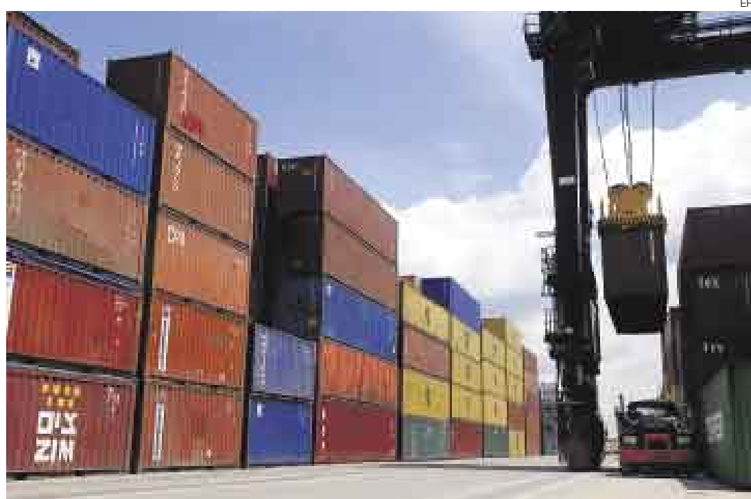
BRAZOS CAÍDOS. La huelga de los estibadores ocasionó un impacto negativo en las actividades del puerto, pese a que Enapu había previsto un plan de contingencia. La Asociación de Exportadores dijo que la situación es dramática.