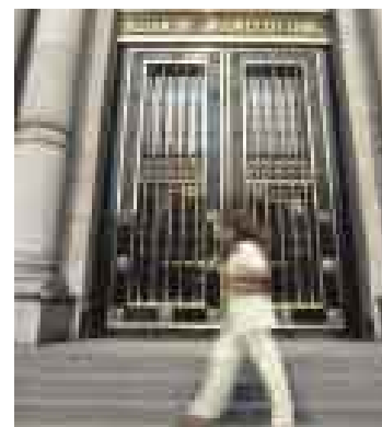
TRANQUILA. Ayer se compraron pocas acciones por feriado en EE.UU.