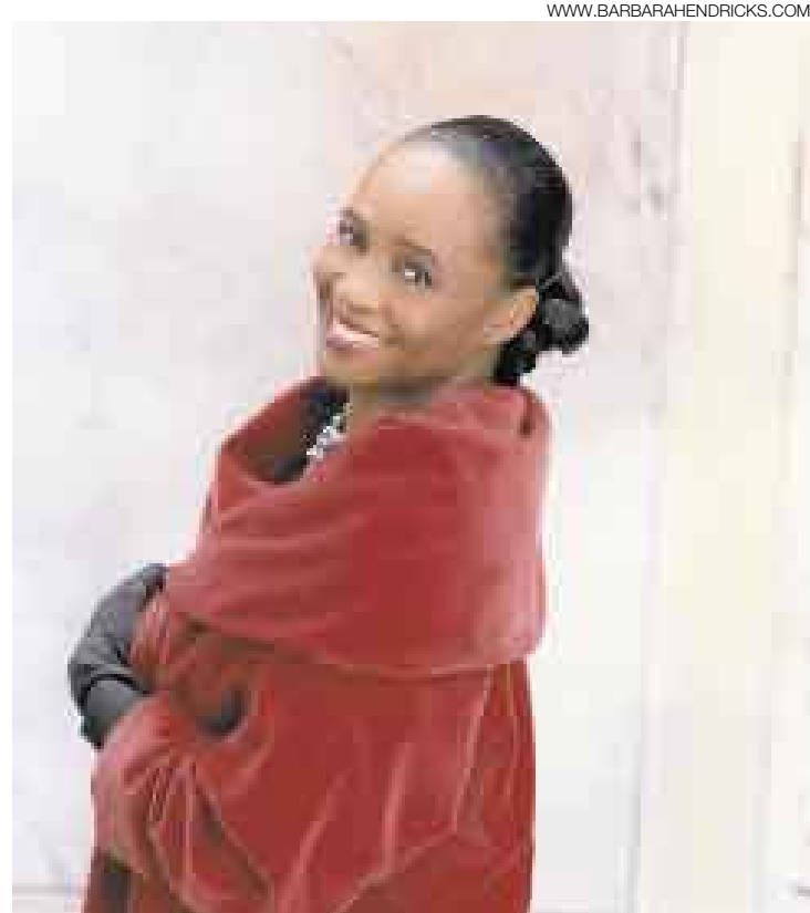
VISIONARIA. La famosa cantante de ópera, que acaba de lanzar su nueva producción, ofrece música en Internet a precios muy atractivos.

Hendricks, quien ha vendido unos doce millones de discos en todo el mundo, ha apostado por esta forma de venta con la libertad que le ofrece su propio sello