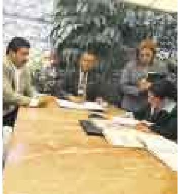
EMPRESAS. Comenzaron inspecciones para verificar el pago de la CTS.

El Ministerio de Trabajo y Promoción del Empleo comenzó ayer una campaña a escala nacional para verificar que las empresas hayan cumplido con el depósito semestral de la compensación por tiempo de servicios (CTS). Unos 280 inspectores y auxiliares verificarán el cumplimiento de esta obligación en una campaña que continuará durante el 2008, y en la que se prevé la fiscalización inmediata de unas 2.000 empresas. Las multas por incumplimiento alcanzan hasta los S/.69.000.