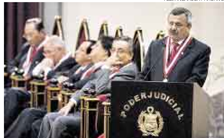
SALA PLENA. El presidente de la Corte Suprema, Francisco Távora, y algunos magistrados supremos no conocían la propuesta de San Martín.