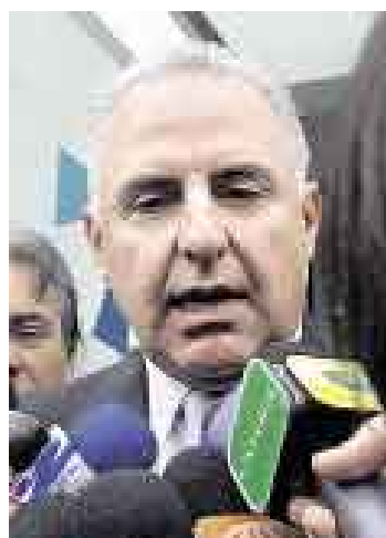
SOLARI. Precisó que el país reclama educación y salud.