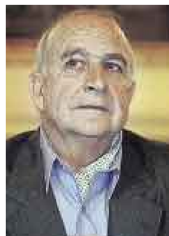
FERRERO. A favor del control aleatorio del Estado.