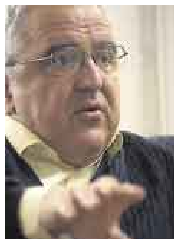
DAÑINO. Recordó que el Acuerdo Nacional pide mejorar competitividad.

Ferrero expresó su coincidencia con lo propuesto por García para que el control del Estado sea aleatorio, que se tercerice la inversión y que haya una transacción en los juicios de menor cuantía. “Con ello concuerdo plenamente, pero hay otros aspectos en los que García está equivocado, como en el tema del empleo público, en que está ignorando que una ley al respecto está desde hace cuatro años en el Congreso lista para ser discutida”.