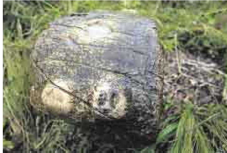
ALTO RELIEVE 2. Casi el mismo dibujo del que sería un dios, puede verse en la piedra ritual ubicada en un templo abierto de Los Gentiles.