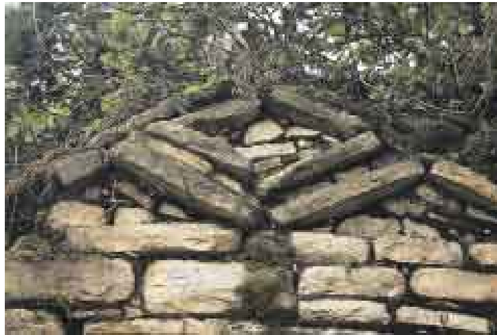
EMBLEMA ROMBOIDAL 2. En Los Gentiles se encuentran intactos, pero endeblés. Los pobladores han reutilizado la llacta para su siembra.

A dos horas de aquí, se encuentran las ruinas de Chanchillo, tampoco declaradas en el INC. Llegar hasta allá es otear el cerro de Teaven (dentro de este se encontrarían las ciudadelas desconocidas más impresionantes, que todavía no pudimos conocer), vislumbrar gigantescos andenes intactos y pasar por socavones mineros del tiempo inca, donde incluso ha-