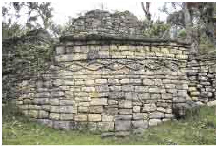
EMBLEMA ROMBOIDAL 1. En Kuélap se encuentran reconstruidos los frisos típicos, porque el 70% de sus construcciones habían colapsado.

La primera estimación de la muralla perimétrica, que no da muestras de colapso, fue calculada por Mondragón en 400 metros de largo (el famoso muro de Kuélap tiene 600).