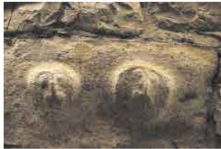
ALTO RELIEVE 1. En las paredes de Kuélap se hallan figuras humanas elaboradas sobre sillar. Quince mil turistas al año pueden verlas.

bría viviendas y cataratas subterráneas. En Chanchillo se hallan construcciones de menor nivel, una muy similar a "el castillo" en Kuélap. En el camino de regreso a La Joya, por campos de zarzas, pueden verse acantilados con tumbas desconocidas, que -como en Karajía y Revash- no han sido saqueadas por lo alto e inexpugnable de los cementerios.