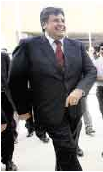
GURÚ. Se abrió el debate sobre el segundo artículo del mandatario.

Es uno de los mejores guionistas del país ['La boca del lobo', 1988; 'La fiesta del chivo', 2005] y acaba de incursionar en la dirección con el thriller psicológico 'Muero por Muriel', de visión obligatoria. Deléitese con sus comentarios