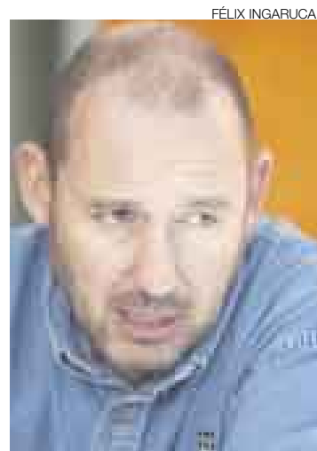
CHLIMPER. Llamó malnacidos a los estibadores. Luego se disculpó.

“Puede que la paralización del terminal marítimo responda a motivos bien fundados; no me siento en capacidad de evaluar los reclamos de los trabajadores portuarios y los argumentos que esgrimen algunos empresarios frente a sus demandas. Ciertamente esta crisis ha llegado a poner en riesgo un sector medular, no solo para el comercio sino también para el propio abastecimiento del país. Me pregunto si una crisis tan extrema y prolongada sería tolerada en (disculpen el ejemplo tan pasado) nuestro vecino país del sur. ¿Y así vamos a ingresar al tratado de libre comercio?”