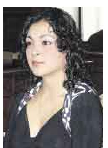
NO HABIDA. Ex teniente no acudió el lunes a escuchar su sentencia.