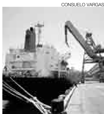
OTRA SALIDA. Alternativa al Callao.

La empresa obtuvo la autorización por parte del MTC luego de cinco meses, pues había presentado el plan maestro del proyecto a la Autoridad Portuaria