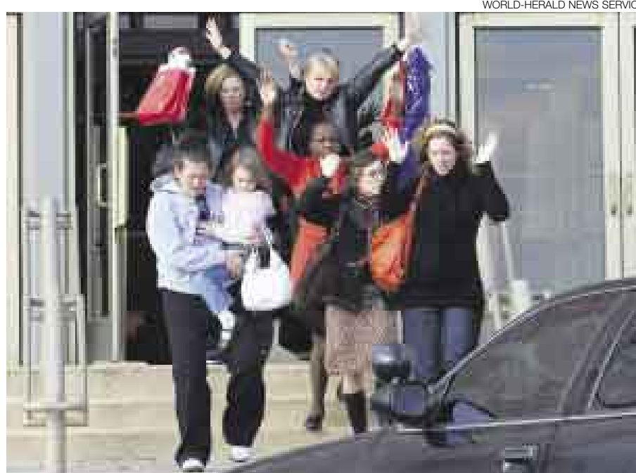
TERROR. Mujeres que estaban dentro del centro comercial, algunas de ellas con sus hijos, debieron salir con las manos en alto para evitar que la policía las confundiera con el asesino.