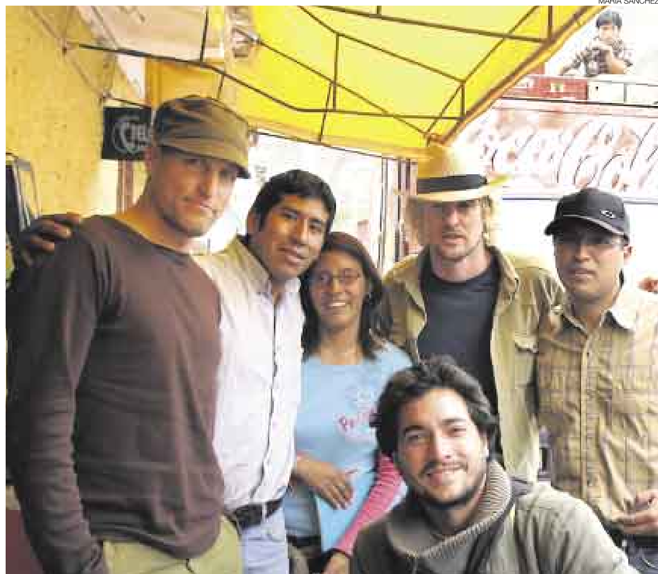
PARA EL RECUERDO. Varios periodistas, entre ellos nuestro corresponsal, se presentaron como 'fans' para fotografiar a los actores.