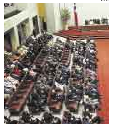
UN PASO. Aún falta la aprobación en la Cámara de Senadores.