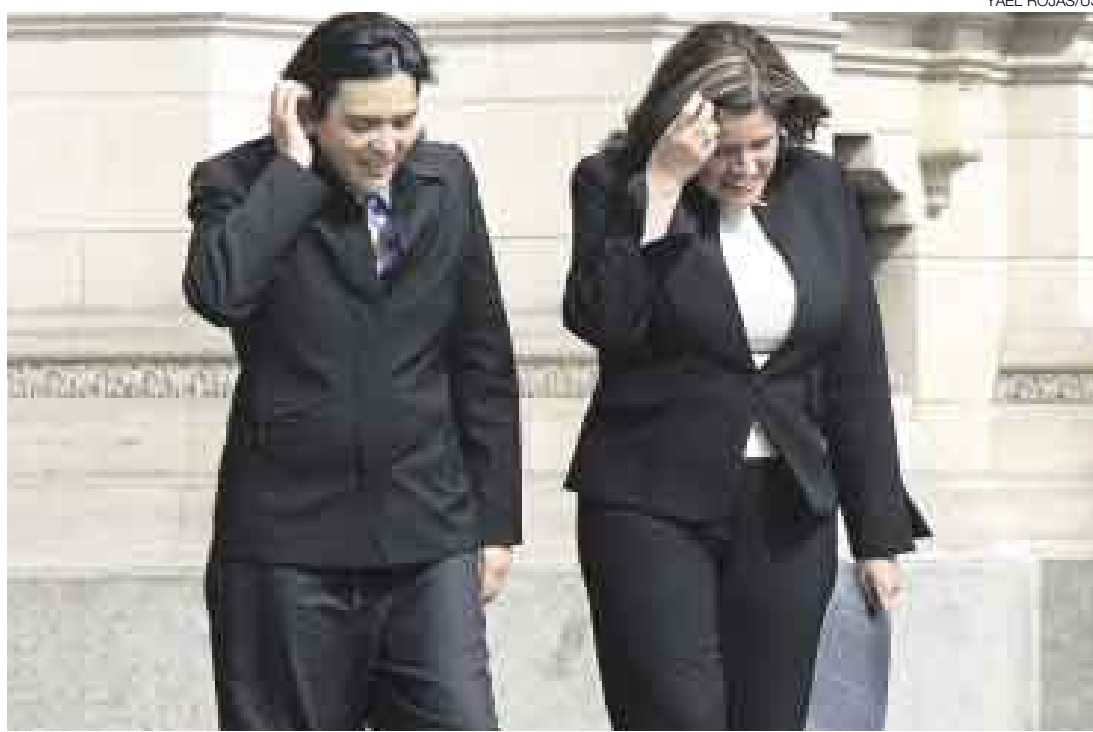
FELICES. En el seno del Ejecutivo se respira optimismo por la reciente firma del TLC con EE.UU. Sin embargo, las adecuaciones para implementar dicho acuerdo aún están pendientes. ¿Serán ocho meses suficiente tiempo?

Según fuentes del Ejecutivo, Carranza dejó de asistir porque percibía que los empresarios daban prioridad a sus propias agen-