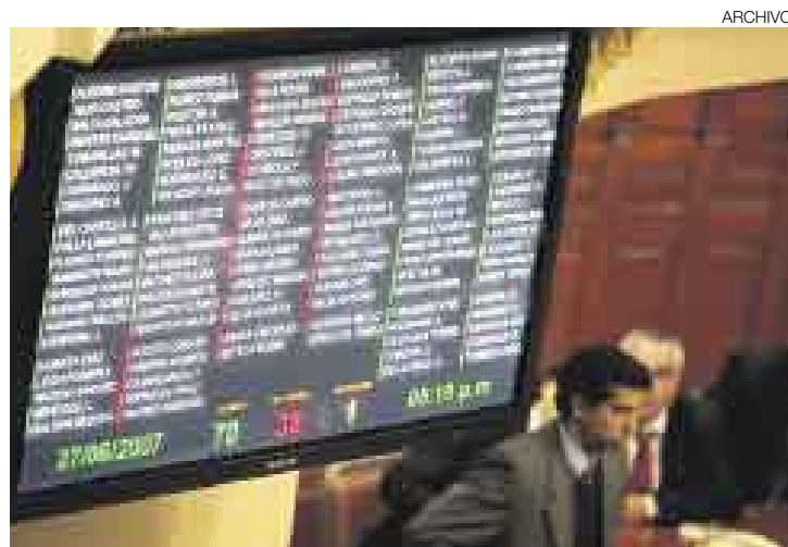
ESTÁ FALLANDO. Este moderno tablero no funcionó ayer impidiendo registrar la asistencia y contabilizar la votación en el pleno del Congreso.

“Entonces, señor relator, sírvase pasar lista a los señores