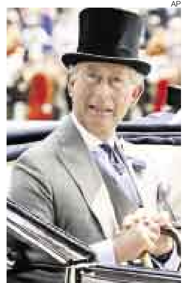
PRÍNCIPE CARLOS. Celebrará su sexta década de vida en el 2008.

LONDRES [EFE]. Fotografías, cuadernos y otros objetos privados del príncipe Carlos de Inglaterra se mostrarán en una exposición, a partir de mayo del 2008, en el castillo de Windsor, residencia oficial de la familia real británica, con motivo del cumpleaños número 60 del heredero al trono del Reino Unido.