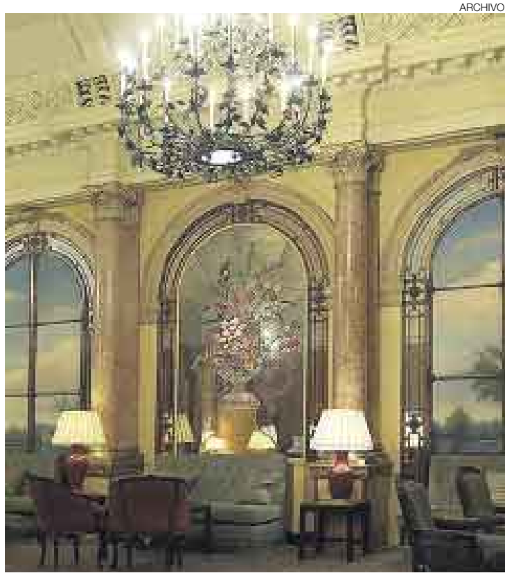
SE RENUEVA. El hotel Savoy, inaugurado el 8 de agosto de 1889, será totalmente remodelado por primera vez en su historia.

Más de un millón de libras (1'400.000 euros) se espera obtener con la venta del mobiliario del Savoy, que abrió sus puertas el 8 de agosto de 1889 entre una gran expectación. No en vano era uno de los primeros lugares públicos del