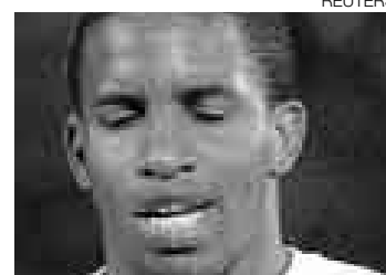
FARFÁN. Testimonios recogidos en el hotel lo incluyen en la lista.