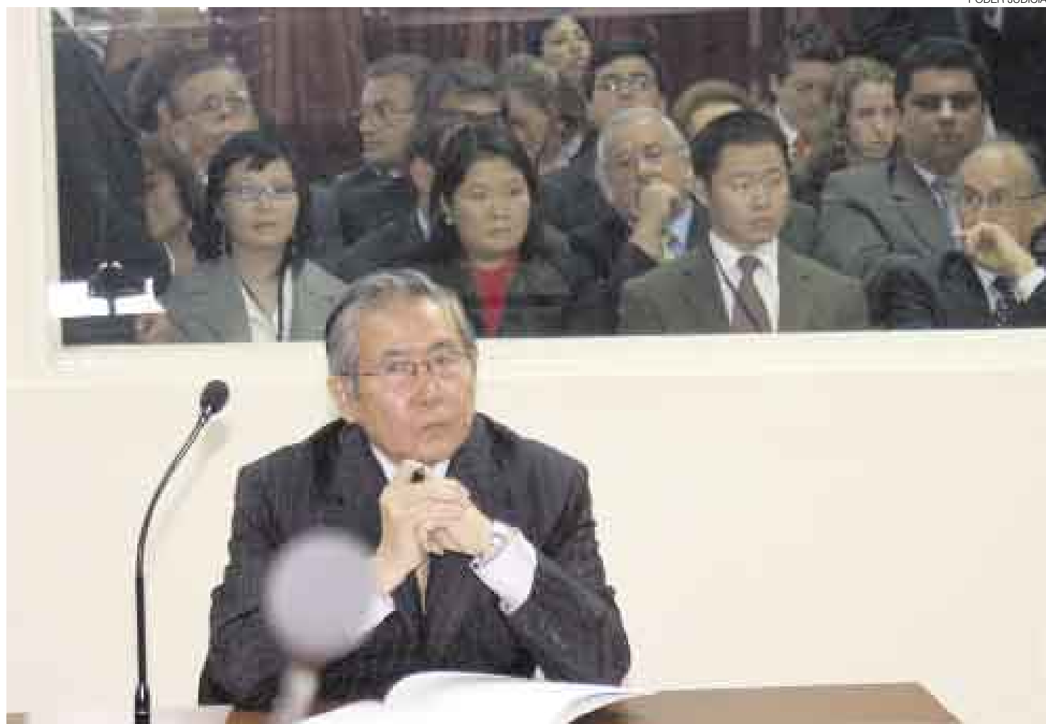
¿Y AHORA? Durante gran parte de la audiencia, sentado en el banquillo de los acusados, Alberto Fujimori mostró un rostro de preocupación.

Para esa hora todos los presentes en la sala de audiencias, seis familiares de las víctimas y 14