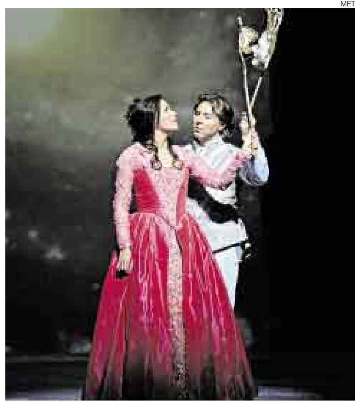
AMANTES IMPETUOSOS. Anna Netrebko y Roberto Alagna se enamoran en la mascarada del primer acto de la ópera de Gounod.

Junto con ella, en el papel del trágico Romeo, encontraremos al controvertido Roberto Alagna. El tenor francés que abandonó la Scala de Milán en medio de un acto de "Aida" tras ser abucheado. Una actitud temperamental,