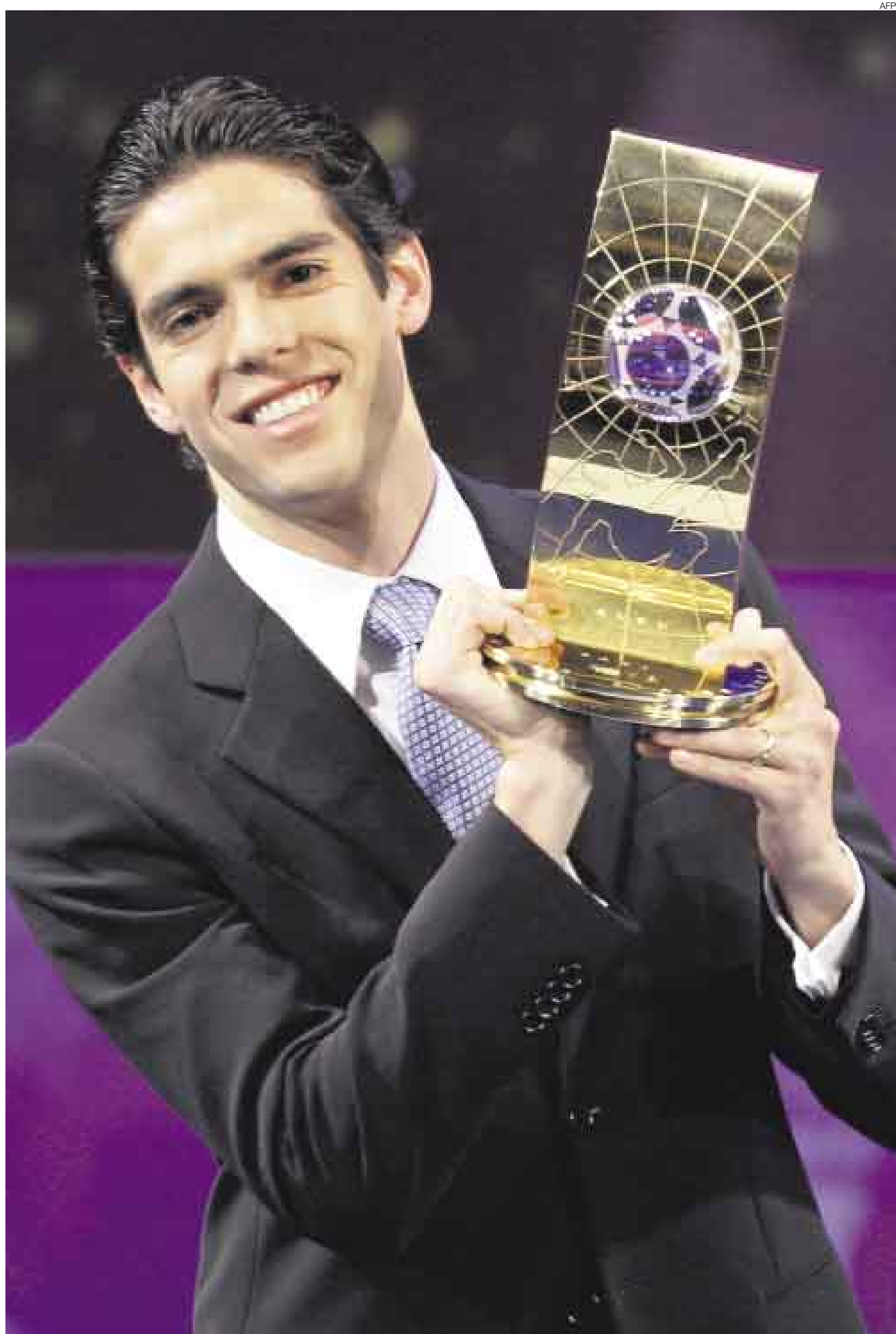
EL CRACK. Kaká con el trofeo otorgado luego de contar los votos de los capitanes y técnicos nacionales de todo el mundo. Chemo eligió a Riquelme.

A los 18 años, tenía el mundo futbolístico a sus pies. También a las mujeres, que identificaron en el espigado jovencito de pelo corto y afeitada al ras un proyecto de 'sex symbol'. Solo faltaba que él quisiera serlo. El problema es que nunca