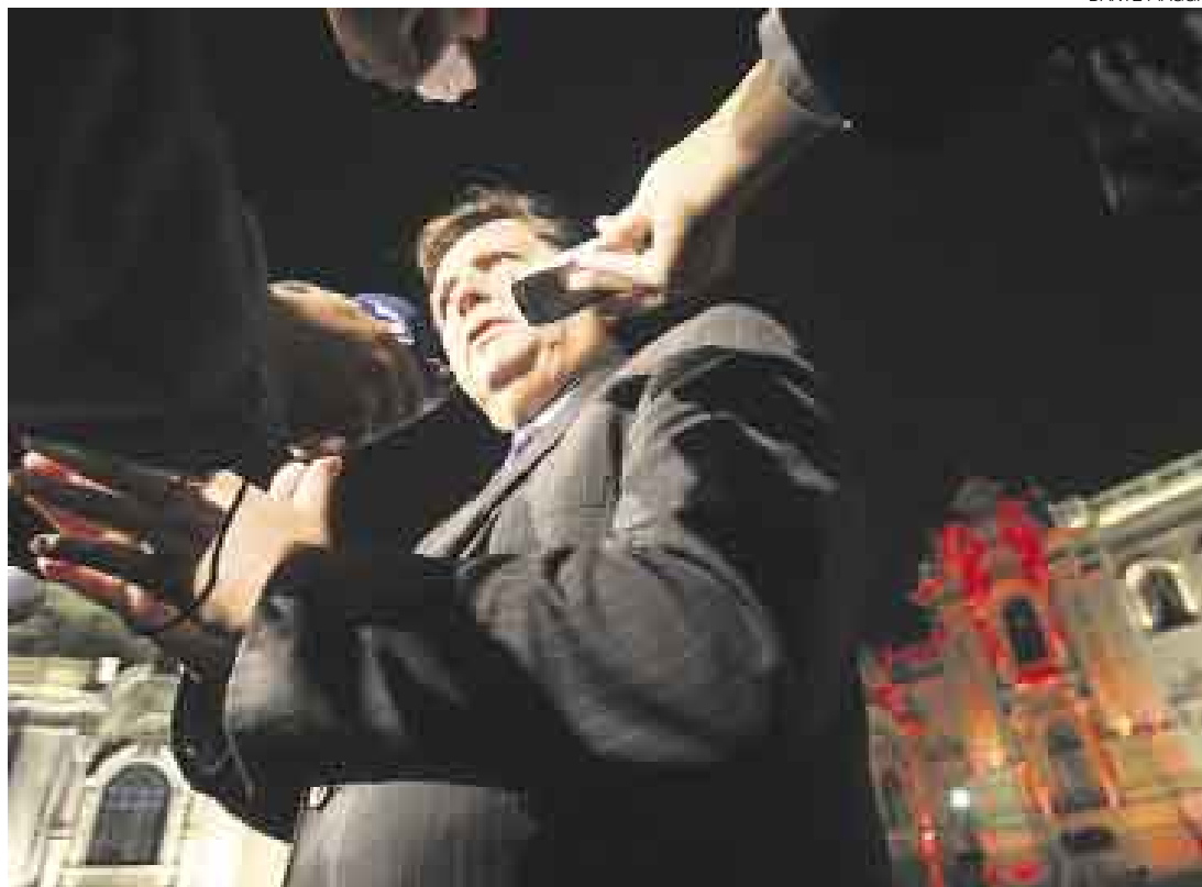
TIENE LA PALABRA. El presidente García aseguró que los ministros no están aferrados a sus cargos, sino que están a disposición del Ejecutivo. “Ninguno ha dicho ‘por favor, no me saque’”, manifestó el jefe del Estado.

También esbozó los criterios que priorizará al momento de decidir los cambios. “Ser ministro a veces no es solamente ser un buen gerente, también se debe ser un buen comunicador”, in-