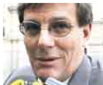
REY. “No hay favores políticos”.