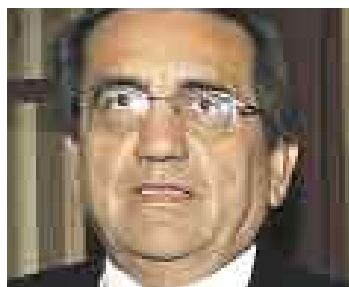
DEL CASTILLO. Palabras con cola.

El gobernante Alan García, por la noche, dijo en Palacio de