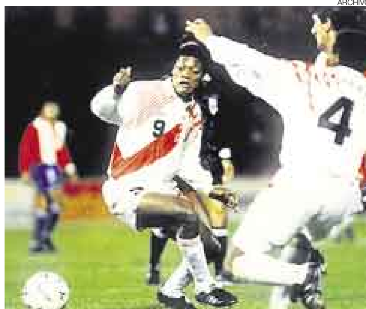
AMNISTIA. Lo suspendieron en 1991, pero en 1993 lo perdonaron para que pudiera jugar las Eliminatorias correspondientes al Mundial de 1994.

de dictar clases de fútbol a un grupo de niñas, que es el primer paso para desenvolverse en su futuro oficio: técnico profesional.