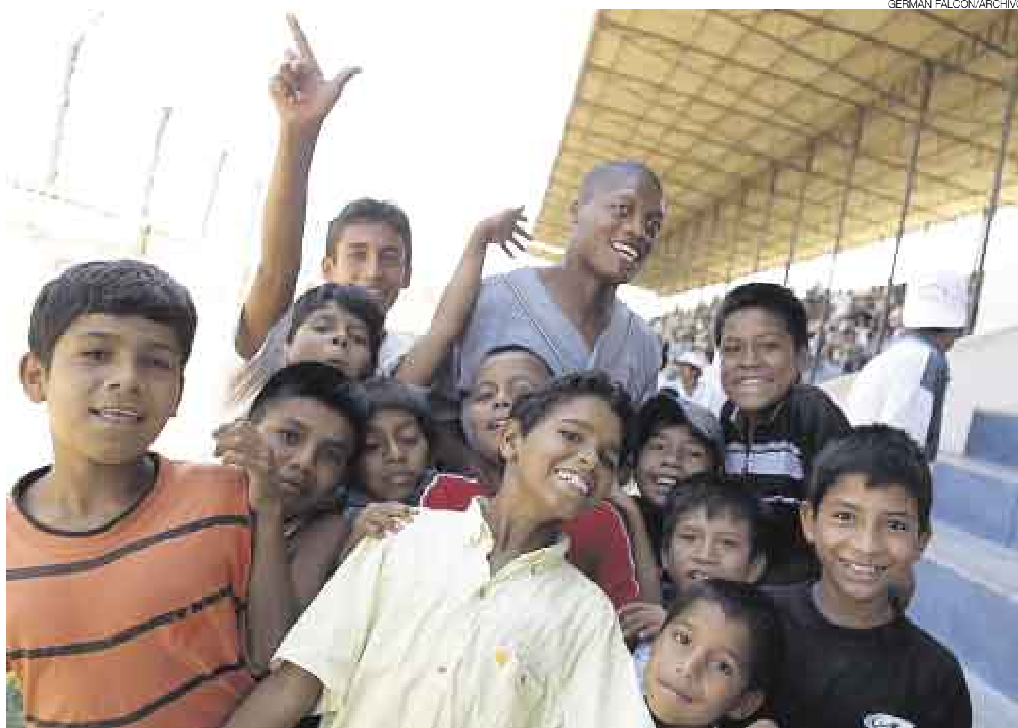
CARISMÁTICO. A 'Balán' se le recuerda por los goles y por su fácil conexión con los hinchas que siempre lo buscaban para fotos como esta.

'Balán', con 39 años encima, ha convertido a Dallas en su base de operaciones. Allí labora desde hace año y medio como empleado de construcción civil, y en paralelo participa en cuanta actividad deportiva se realiza en la zona con los inmigrantes, además