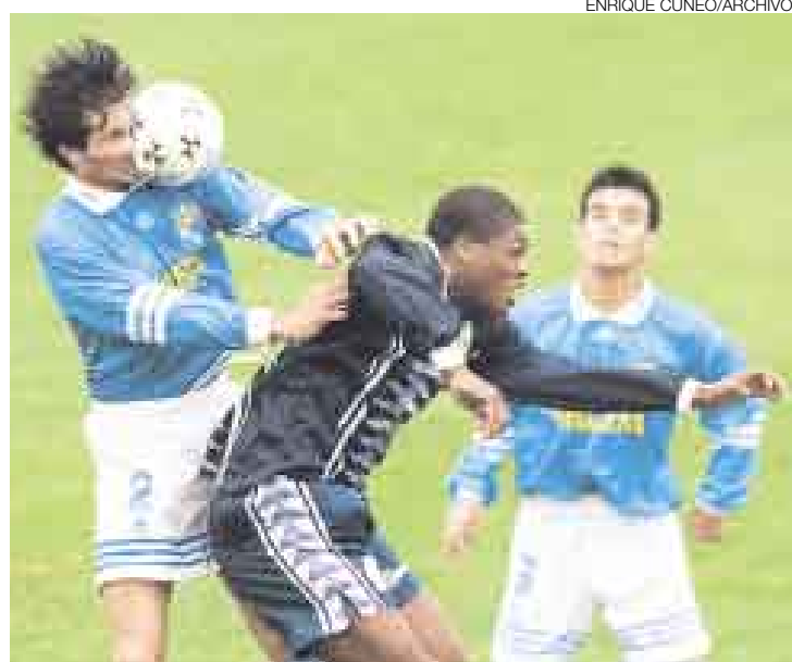
EN TODAS. No solo jugó en los grandes, también pasó por equipos de segundo orden como el Pesquero. Igual se las arregló para anotar.