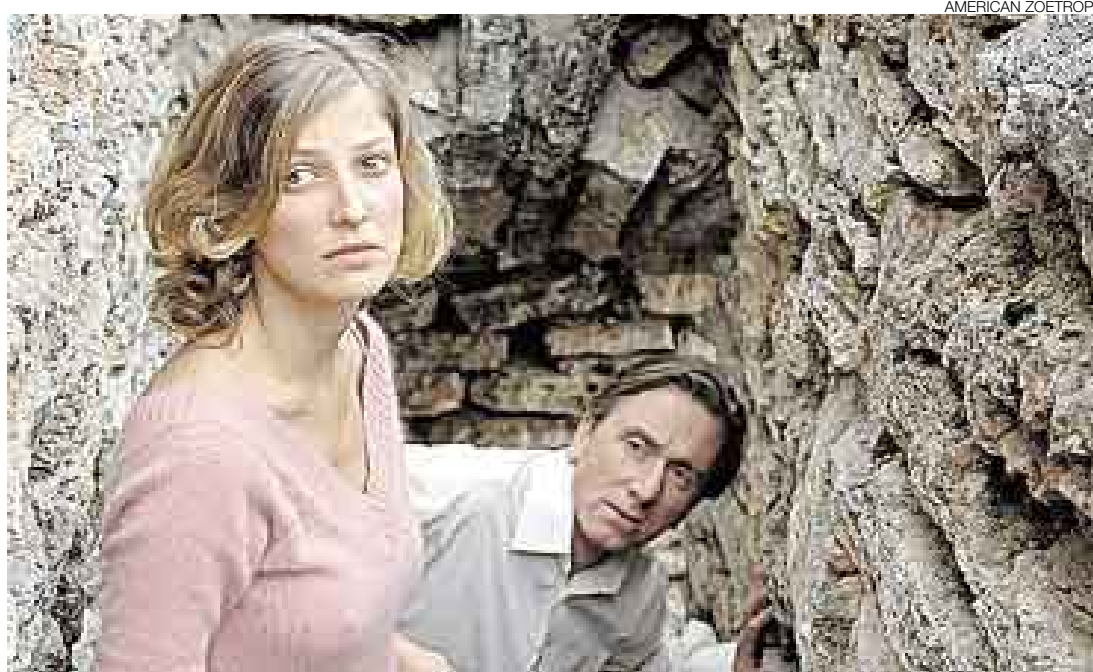
LA PAREJA. Alexandra María Lara y Tim Roth protagonizan una historia situada en Rumanía poco antes de la II Guerra.

REGRESA. Coppola cerró un ciclo de películas filmadas por encargo. Con "Youth Without Youth" retoma un estilo artesanal de producción. En la imagen, con el actor Tim Roth, caminando por el viejo palacio de Balchick (Bulgaria), en las costas del mar negro.