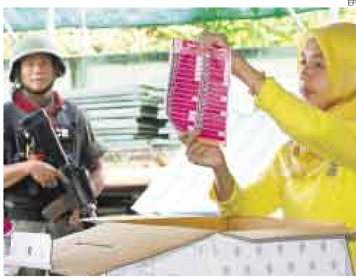
VIGILANCIA. La elección se dio con un tercio del país bajo ley marcial.

"Es una victoria para el pueblo y para la democracia", añadió Surapong al tiempo que subrayó cómo los resultados demuestran que el golpe de Estado, de hace