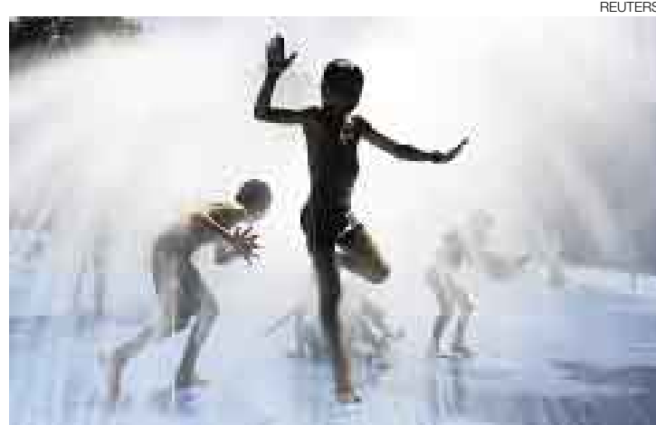
REMEDIOS. Los europeos buscaron diversas maneras para refrescarse.

WASHINGTON [AP]. El 2007 fue la comidilla de los meteorólogos: las temperaturas subieron considerablemente y el clima se tornó más antojadizo. Enero fue el primer mes más caluroso de que se tiene registro en todo el mundo. Las estaciones meteorológicas estadounidenses registraron récords absolutos o empatados de calor 263 veces en el año, según un análisis de AP sobre datos meteorológicos estadounidenses.