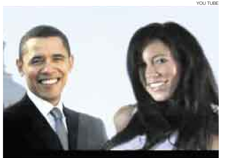
PREFERIDOS. Veal los videos en http://blogs.elcomercio.com.pe/vidayfuturo

El ranking tuvo en cuenta los más compartidos, los más comentados, los mejor calificados y su popularidad general para determinar cuáles eran aquellos de los que la gente más hablaba.