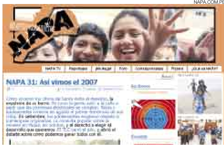
AL MUNDO. Durante el próximo año continuaremos difundiendo la labor de los bloggers que ofrecen contenido original y propio.

Uno de los nuevos conceptos que están relacionados estrechamente con la Web 2.0 es el de 'prosumidor', término que hace referencia al consumidor de información transmitida por la red que deja su papel pasivo para convertirse en un participante activo en la producción de contenido en línea. Y nuestro país no