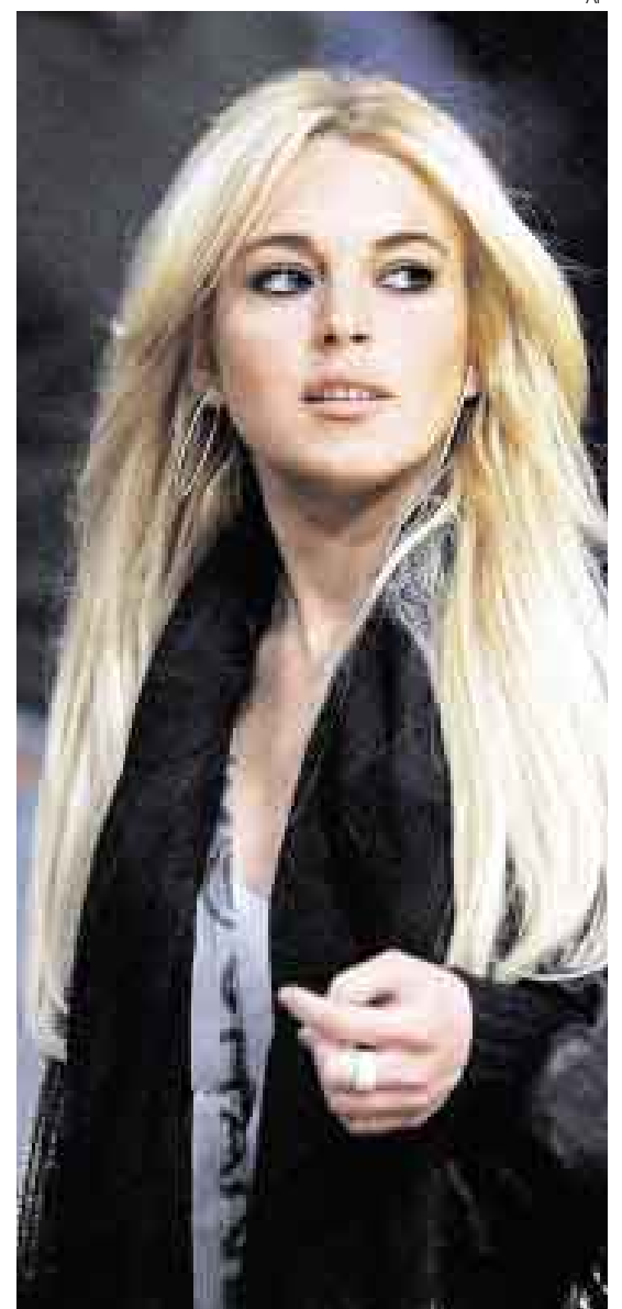
ÁNGEL Y DEMONIO. Neoyorquina coqueta y avispada, la sensual Lindsay Lohan fue una de las chicas problema de Hollywood.