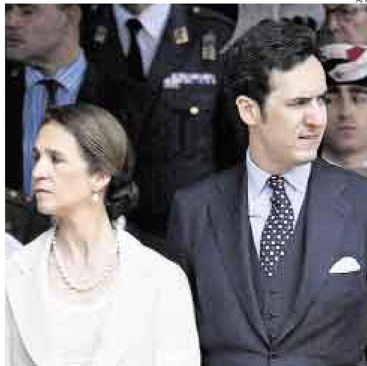
ESCÁNDALO REAL. La hija mayor de los reyes de España, la infanta Elena, se separó de Jaime Marichalar.