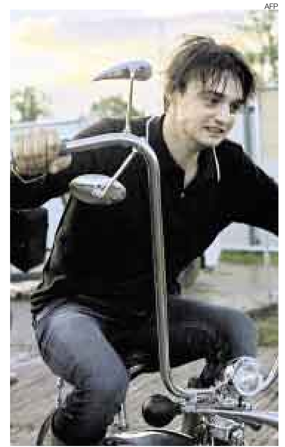
TORMENTOSO. Su adicción a las drogas y su agitado estilo de vida complicaron la relación del músico Pete Doherty con la modelo Kate Moss.