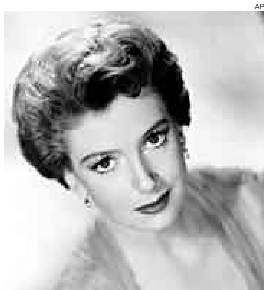
DEBORAH KERR. Uno de los rostros más conocidos del cine en los años 50 murió el 16 de octubre.