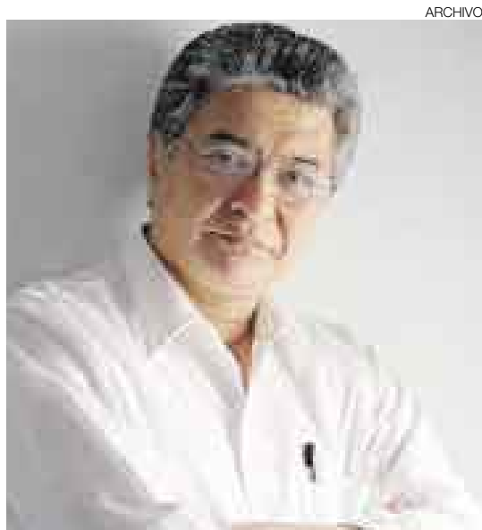
JOSÉ WATANABE. Uno de los poetas peruanos más importantes del siglo XX no dejó el 25 de abril.