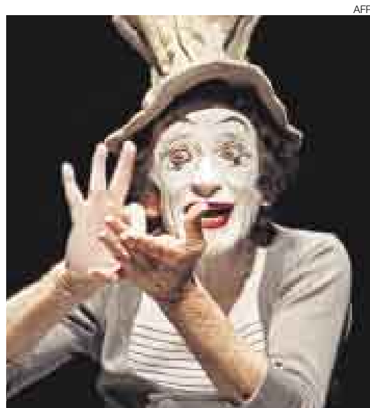
MARCEL MARCEAU. El mejor mimo del mundo falleció a los 84 años. Añadió a su entrañable personaje Bip.