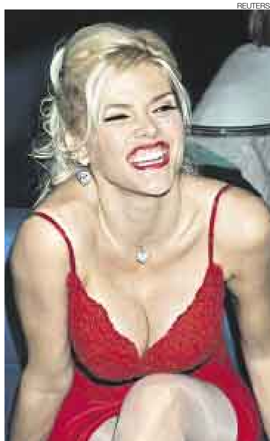
ANNA NICOLE SMITH. Tenía 39 años cuando murió.

El escritor Kurt Vonnegut muere a los 85 años. Fue autor de 14 novelas, y destacan las de ciencia ficción.