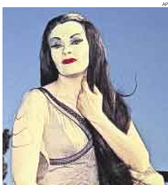
YVONNE DE CARLO. Ya era famosa cuando participó en la serie "La Familia Munsters" de la cadena CBS.