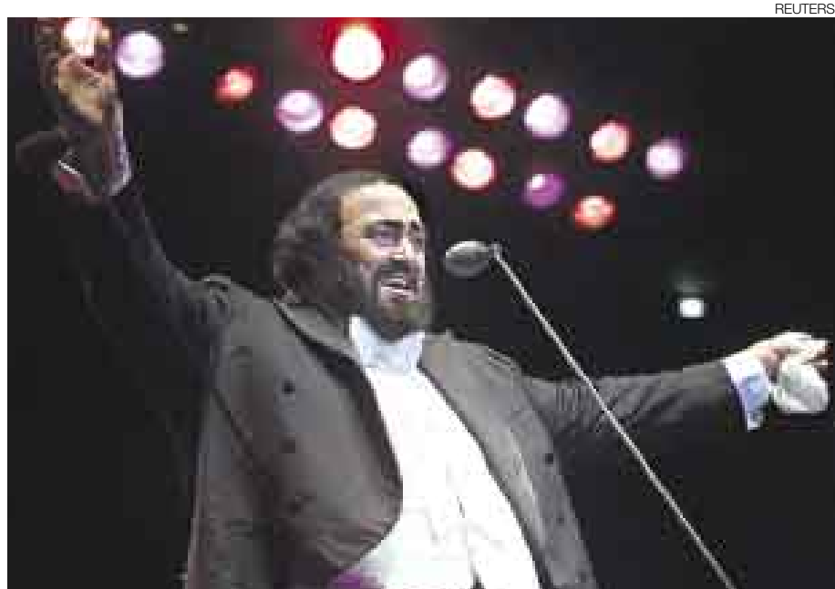
LUCIANO PAVAROTTI. El tenor que popularizó la ópera gracias a los conciertos televisados con Plácido Domingo y José Carreras, falleció el pasado 6 de setiembre.

★ EL 2007 FUE TESTIGO DE LA PARTIDA DE FAMOSOS ARTISTAS E INTELLECTUALES ★ LA DESPEDIDA SE INICIÓ CON LA MUERTE DE LA ACTRIZ YVONNE DE CARLO Y SE CIERRA CON LA PARTIDA DEL CÉLEBRE PIANISTA CANADIENSE DE JAZZ OSCAR PETERSON